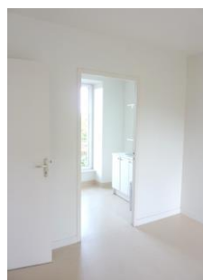
Chambre avec salle de bains attenante