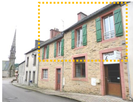
Façade avant (côté rue)