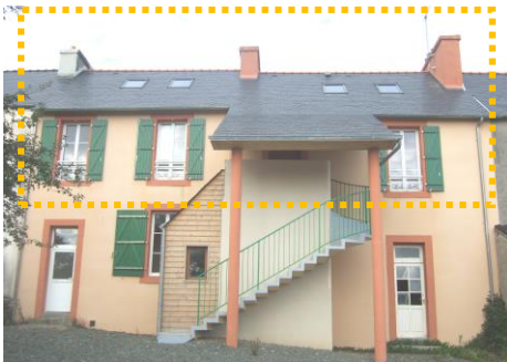
Façade arrière (entrée)

Combles : 2 chambres (13 et 15 m 2 ) - Salle d'eau – Dégagements (20 m 2 )