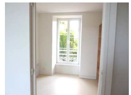
Bureau ou dressing